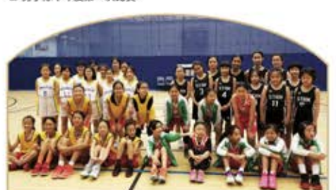
▲ 聖誕節比賽女子隊合照