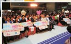
▲ 頒獎典禮假九龍灣展覽中心舉行