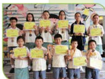
▲《華夏盃》全國數學奧林匹克邀請賽總決賽個人得獎者