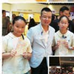
▲ 得獎同學和負責老師合照