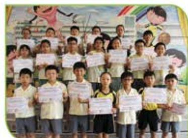
▲ 環亞太杯國際數學邀請賽一、二等獎的個人得獎者