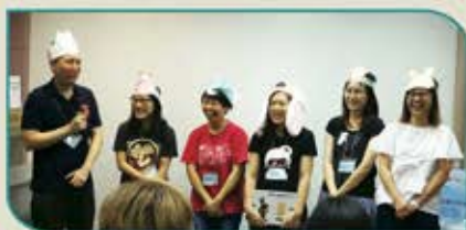
▲ 故事姨姨們用心到宗教教育中心學習講故事技巧