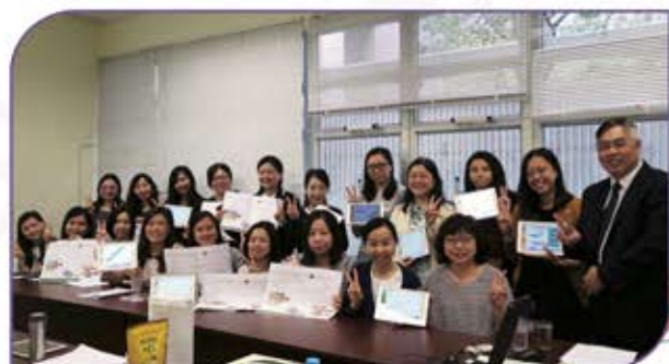
▲ 友校同工到訪作同儕觀課、評課

今年，我很高興能夠參與這個音樂科課程計劃，現時，電子學習已成為一個教學新趨勢，能在音樂科引入電子科技更是本校先河，因此我極為期待。