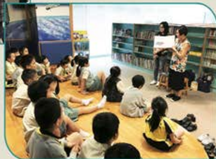
▲ 心心姨姨(左)及啤梨姨姨(右)