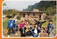
▲ 農戶親手建造他們的房子呢！