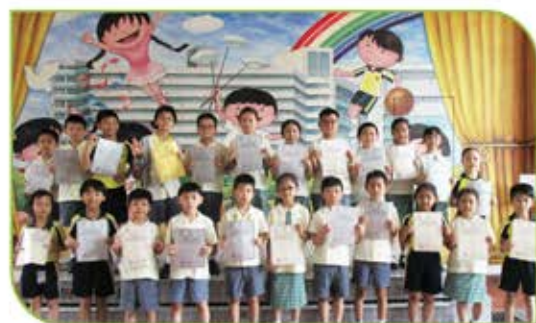
▲ 港澳數學奧林匹克公開賽個人得獎者 (P.1至P.4)