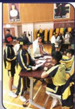
▲ 了解毒品，向毒品 Say No!