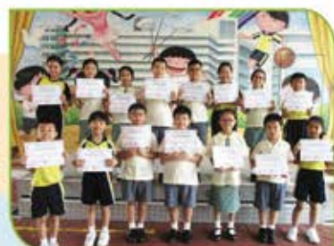
▲ 環亞太杯國際數學邀請賽三等獎得獎者 (P.2至P.4)