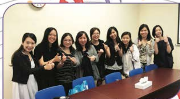
▲ 我校音樂科組全體同事參與同儕觀課及評課