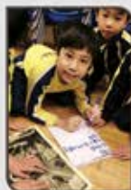
▲ 觀察及記錄我們的發現。