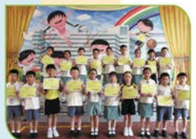
▲《華夏盃》全國數學奧林匹克邀請賽(香港賽區)個人得獎者(二至四年級)