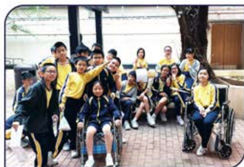
▲ 我們體會了坐輪椅的感受。

六年級同學們相當投入「服務學習」活動，各班同學積極和服務對象溝通，付出了不少時間和心思去策畫及推行適合服務對象之活動。同學們與服務對象成了好朋友，在他們身上領悟如何面對生活上的各種困難和挑戰，學習服務對象們熱愛生命、不斷學習和盡展所長的精神。在活動過程中，同學們感恩自己所擁有的一切，對社區內不同階層人士表現尊重的態度。六年級同學們，你們成長了，深信畢業後，你們能繼續發揮我ails的精神，實踐愛主愛人的行動，讓世間更暖！