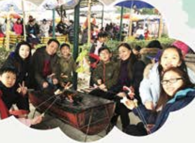
▲很美味，大家一起燒烤！