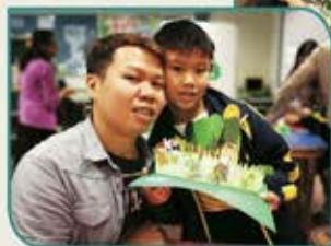
▲ 親子同心，製作立體書有難度！