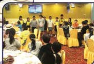
▲ 同學們的話劇很出色!