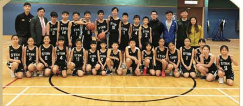
▲ 學界比賽後大合照