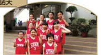
▲ 女子隊本年度第一次比賽