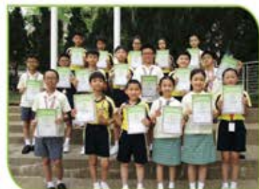
▲ 全港小學數學挑戰賽初賽的個人得獎者