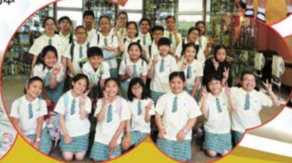
▲ 我們在「JSMA聯校音樂大賽」奪得一全一銀的優異成績，實在太高興呢!