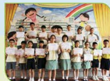
▲ 環亞太杯國際數學邀請賽三等獎的個人得獎者 (五、六年級)