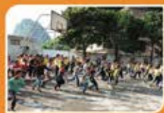
▲ 我們和山區小朋友一起遊戲。