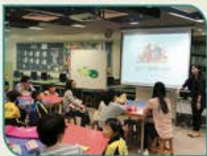
▲ 安徒生會同工帶領家長及學生一同製作立體書

家長教師會與圖書組邀請了「安徒生會」到我校舉辦親子故事工作坊，目的是希望透過以互動故事配合延伸活動，讓學生及家長輕鬆體驗閱讀的樂趣。當日工作坊透過故事《愛麗絲夢遊仙境》及生動的互動活動，讓學生閱讀故事後，與家長一同合作製作立體書，參與家長及學生藉此體驗及享受到親子閱讀之樂。