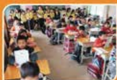
▲ 山區的小朋友很認真學習呢！