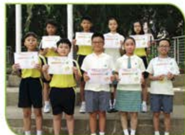
▲ 小學數學精英大賽的個人得獎者