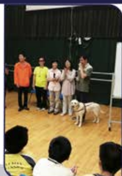
▲ 視障人士的話劇很精彩!