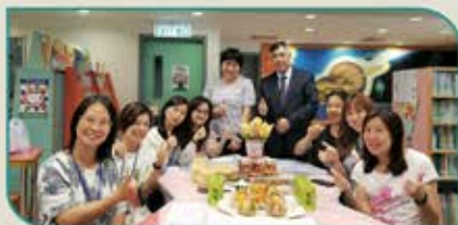
▲ 終於完成本學年的說故事活動了，要慶功一番！