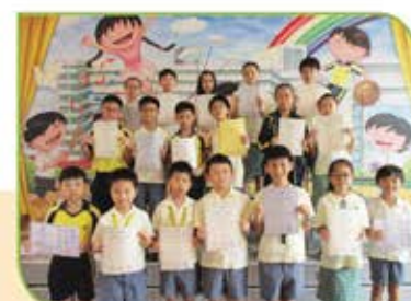
▲ 港澳數學奧林匹克公開賽決賽及晉級賽的個人得獎者