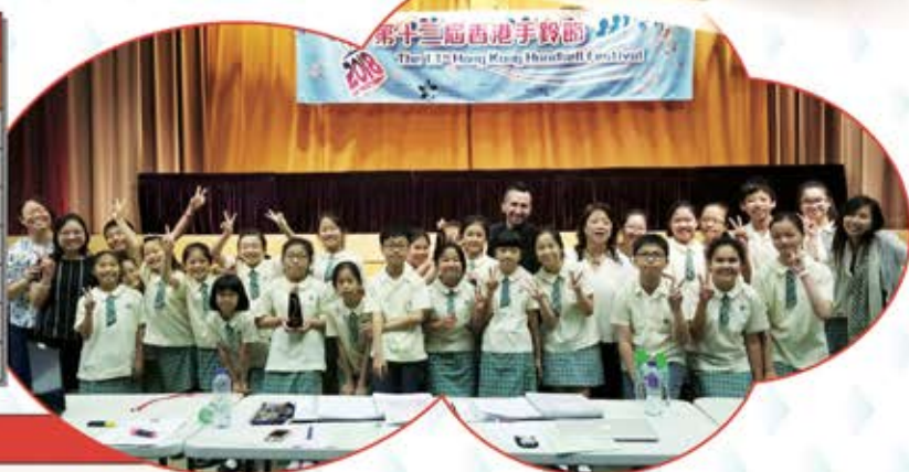
▲ 我們在「第十三屆校際手鈴比賽」中奪得的兩個銅獎，皆大歡喜呢！