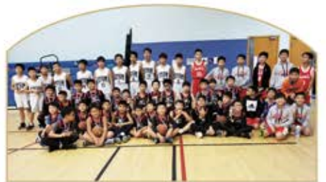
▲ 聖誕節比賽男子隊合照