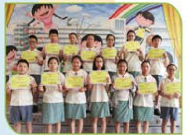
▲《華夏盃》全國數學奧林匹克邀請賽(香港賽區)個人得獎者(六年級)