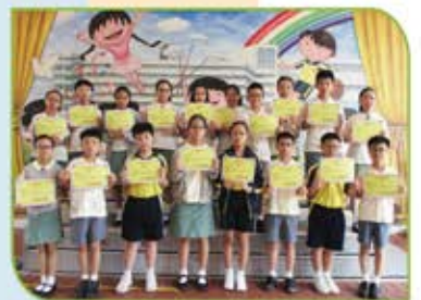
▲《華夏盃》全國數學奧林匹克邀請賽(華南賽區)晉級賽個人得獎者(五、六年級)