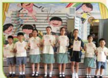
▲ COMO兩岸菁英數學邀請賽個人得獎者