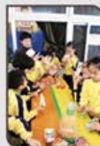
▲ 有麵包牛奶，已很富足！