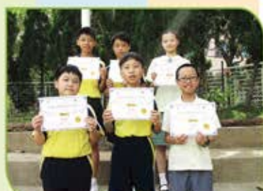
▲ 全港小學數學比賽的個人得獎者