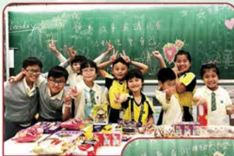
▲ 愉快的賽後感恩茶聚