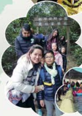
▲真開心，大家一起來合照。