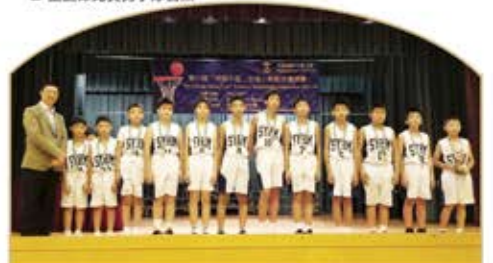
▲ 男子隊本年度第一次比賽