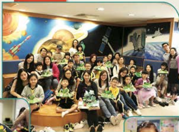
▲ 大家一同拿著成果來個大合照！