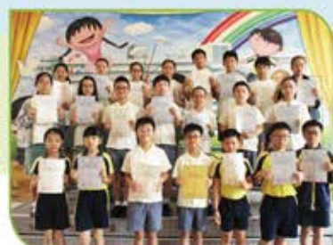
▲ 港澳數學奧林匹克公開賽個人得獎者 (五、六年級)