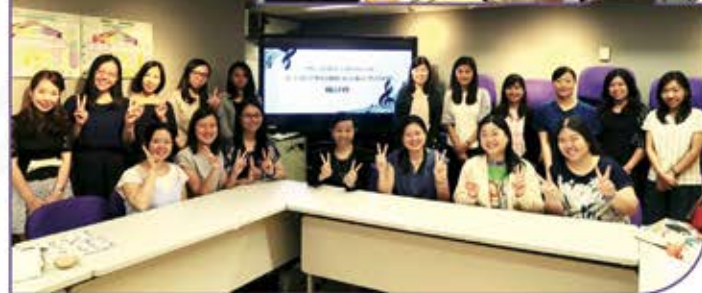
▲ 參與是次計劃的全體同工