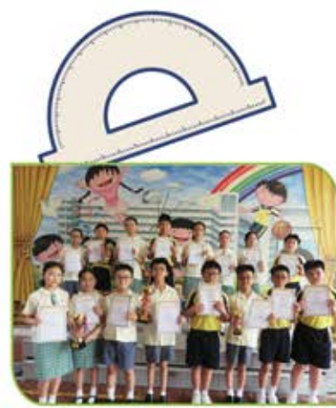
▲ 本校學生在「全港小學數學挑戰賽」取得「最積極參與獎」及四個團體獎的佳績！