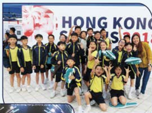
▲ 國泰航空匯豐香港國際七人欖球賽

在訓練的過程中，我曾遇到不少艱苦，但我認為得著的比苦楚更多。我很感謝老師悉心的教導，讓我學懂很多關於欖球上的技術。雖然在欖球比賽那天我因腳受傷而不能出賽，但當我知道我們五年級同學已經拼盡全力，但最後只能得到第四名，我決定日後一定要更勤奮地練習，期望明年能取得更好的成績。我很感恩一直得到教練和隊員的支持和鼓勵呢！