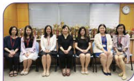
▲ 到友校觀課及參與並不同的工作坊，作專業交流