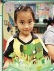
▲ 看！媽媽與我製作的立體書多美！