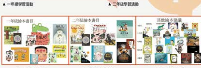
▲ 一年級繪本書目 ▲ 二年級繪本書目 ▲ 其他繪本建議