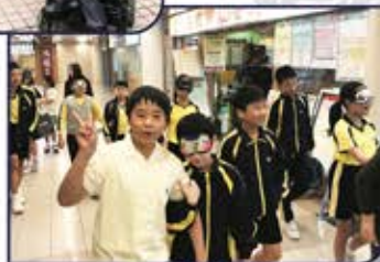
▲ 看不見也能向前走。