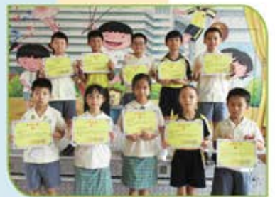
▲《華夏盃》全國數學奧林匹克邀請賽(華南賽區)晉級賽個人得獎者(三、四年級)