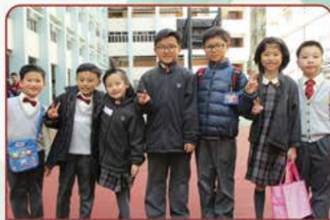
▲ 大家信心十足準備比賽