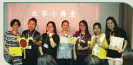
▲ 故事姨姨們在學習時實習情況