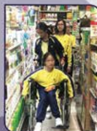
▲ 坐輪椅逛超級市場。