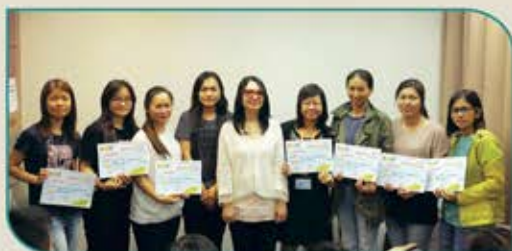
▲ 一連三次的故事義工工作坊完成了，故事姨姨們在主辦機構手上領取畢業證書