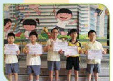
▲環亞太杯國際數學邀請賽進階賽個人得獎者