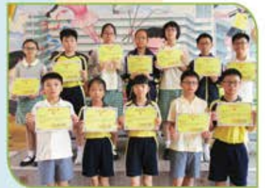
▲《華夏盃》全國數學奧林匹克邀請賽(香港賽區)個人得獎者(五年級)